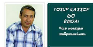
(Материаллар атоқли ўзбек шоири Хуршид Давроннинг Фейсбугдаги саҳифасидан олинди.)