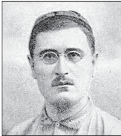
ТАВФИҚ ФИКРАТ ҲАҚИДА

Усмонли адабиётини оз-моз ўқуганлар, унинг билан бир даража ошно бўлганлардан қайси бириси бу исми билмайди, қайси бириси муниманимайди.