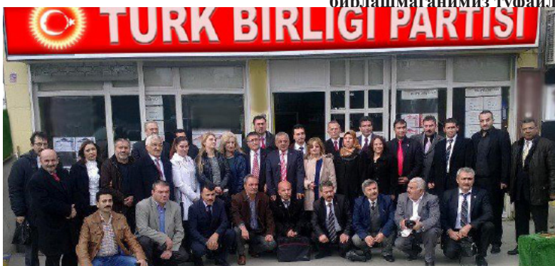
А н ж у м а н қ а т н а ш ч и л а р и д а н б и р г р у п п и