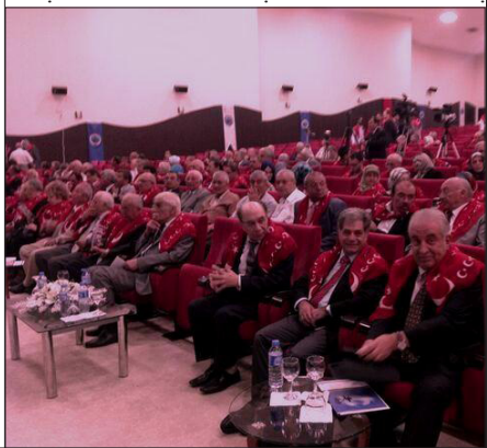
Мажлис аҳлининг бир қисми

Йўқ, ўз-ўзидан бундай бўлмади. Бу жанжални кўрган КГБчилар икки халқ орасида: гўё фарғонали туркий ўзбеклар Ахиска туркларининг болаларини ўлдиришгаётгани, қуйдиришгаётгани, ҳатто паншаҳаларда бошлари бўйи кўтариб юришгани ҳақидаги сохта “фото”ларни, варақаларни таркатдилар... Фарғоналикларнинг онгсиз қисмига (афсуски ўша пайтда улар оз эмас эдилар) уларнинг камбағаллигининг сабаби туркларнинг бу ерда яшаётгани дея тушунтирилди ва баъзилари бу гапга лакка ишонишди